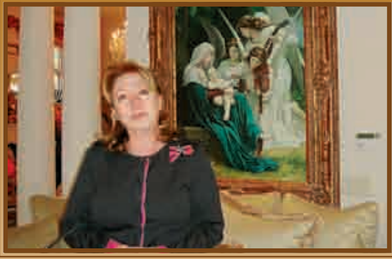
بقلم كلير منصور

رئيسة جمعية اورشليم الجديدة - لوس انجلوس - كاليفورنيا