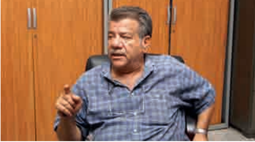
فخور بهويتي اللبنانية

لم يعرف سن الطفولة، ابتداءً بالعمل في الخليج بسن الثانية عشر، والده كان استاذ في صناعة ميكانيك الحديد، فهو يعيش غانا وله بصمات كثيرة: في كوماسي، وعلاقته مميزة مع ملكها. وفي مكتبه كان هذا اللقاء.