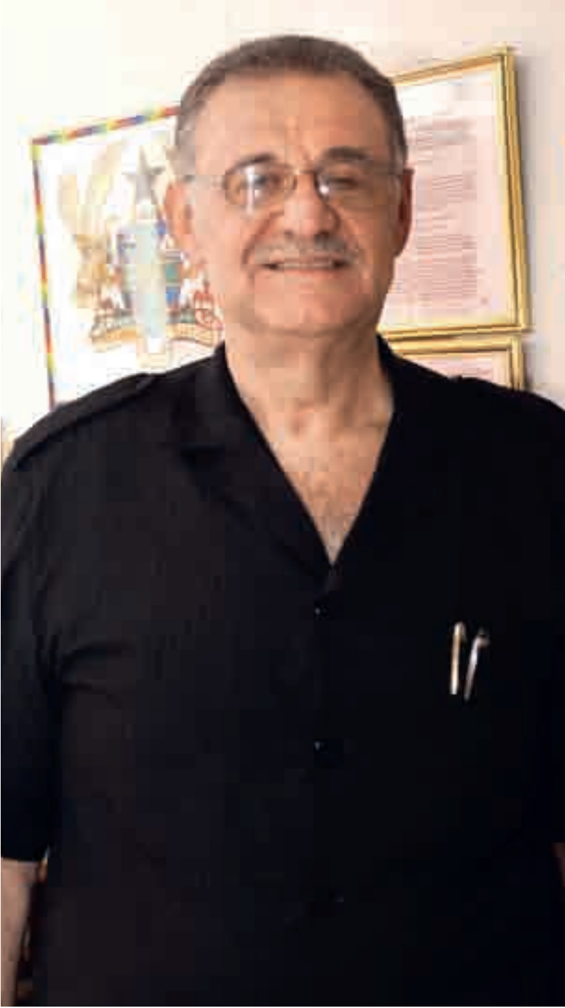
الجامعة جسر للوطن