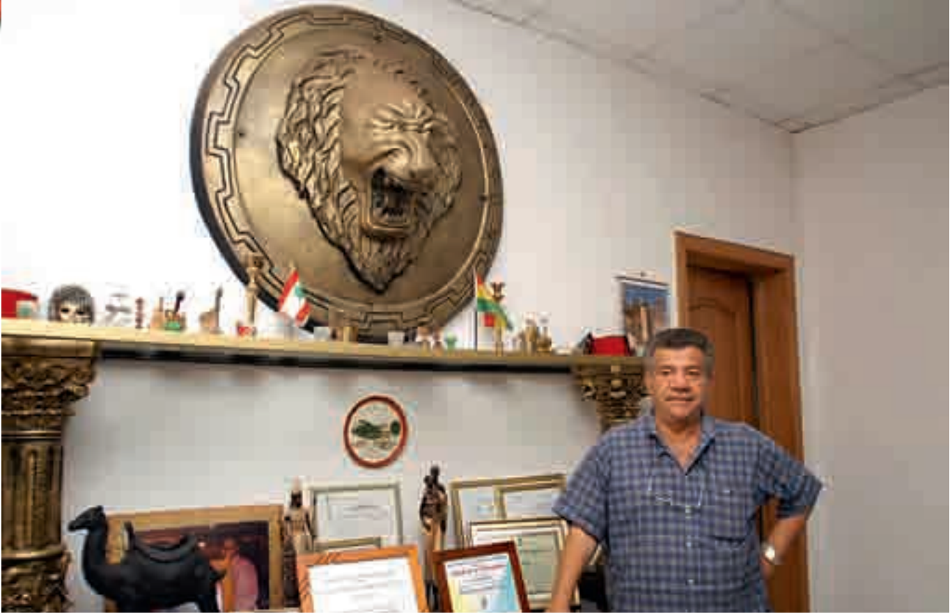
غانا اعطتني الكثير