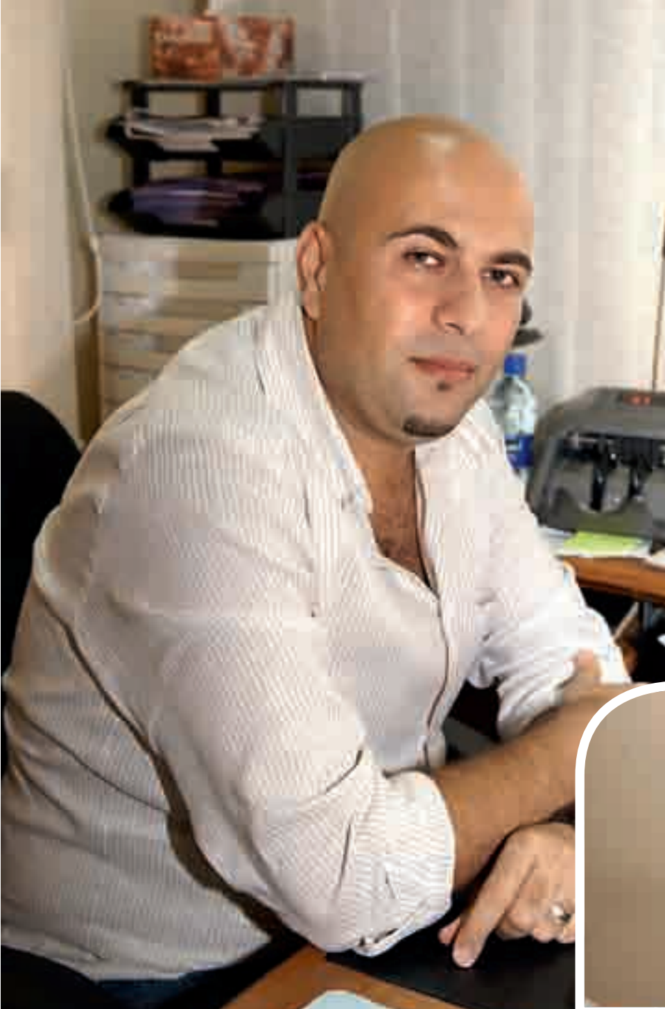
الفرصة لا تأتي مرتين

من روزنامة سنة واحدة، مضت عشر سنوات فهو يرى بأن لا احد يدرك قيمة الوطن الا الذي يبتعد عنه، أما ضريبة الاغتراب فهي اجتماعية، صحية ونفسية، وفي كوماسي أجرت معه الحاضر هذا اللقاء.