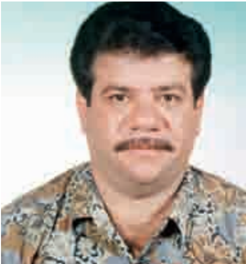
المغترب يساهم في اقتصاد لبنان