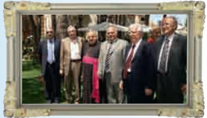
المطران ابو جودة مع الوزير فتفت والسفير الترك وعيد الشدراوي