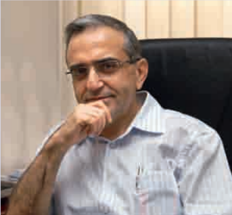
طرابلس ذكريات الطفولة