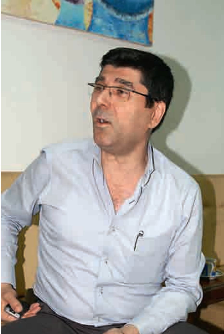
كل مغترب سفير لوطنه