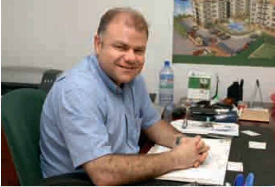
طرابلس البداية والنهاية

على الله، لذا يحتم علينا اقامة حماية ذاتية مع الشعب الغاني، فنحن بحاجة الى سفارة قوية تحمي حقوق اللبنانيين وسفير يجمع الجالية تحت السقف اللبناني.