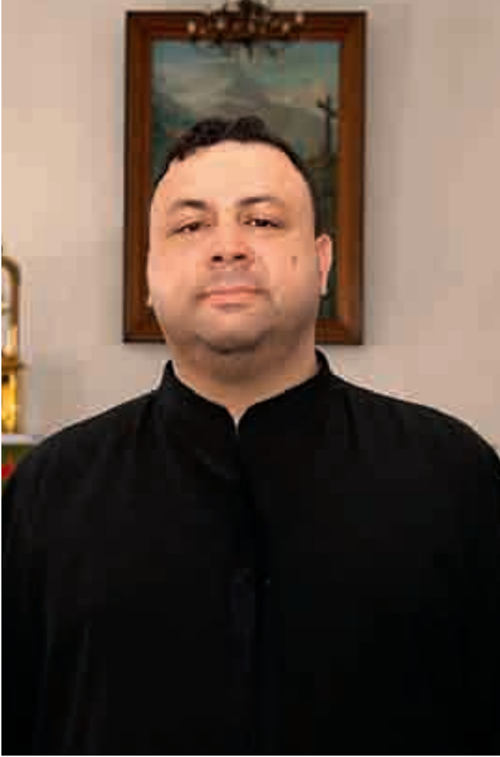
دعوتي كانت تلاحقني