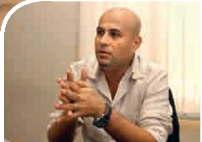
هناك ضريبة يدفعها المغترب

احياناً الصدفة تلعب دورها وتغير حياتك، فأنا جئت الى ساحل العاج منذ عشر سنوات لبيع روزنامة لنادي الزرارية في لبنان، كنت فعالاً اجتماعياً في نادي الشبيبة في لبنان، بالصدفة تعرفت على بعض اللبنانيين الذين عرضوا علي العمل في ساحل العاج وهكذا استقرت في افريقيا، ومنذ ثماني سنوات انتقلت الى غانا وبالتحديد الى كوماسي وأسست شركة كمبيوتر مع تصليح وقطع غيار.