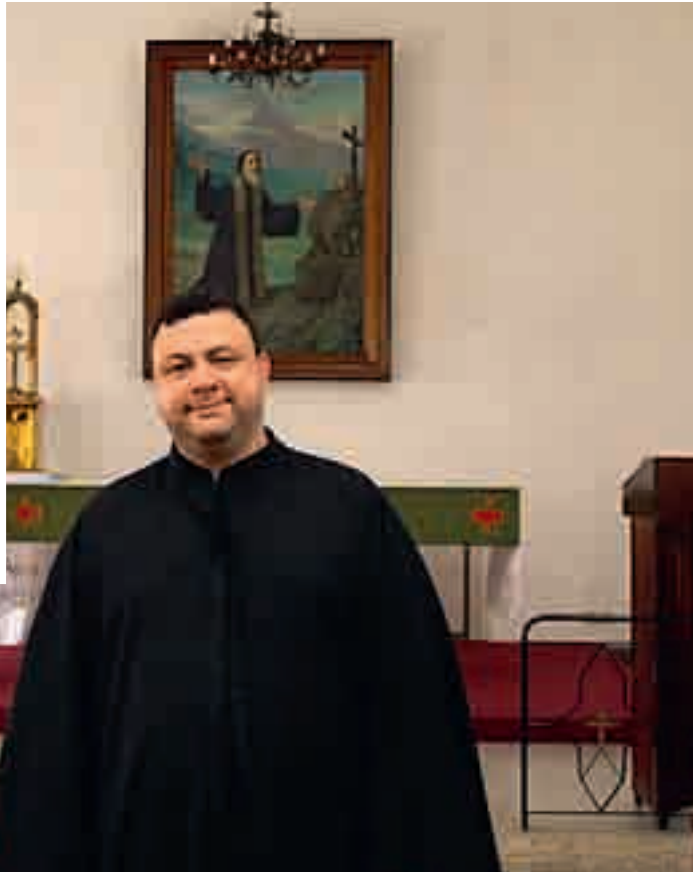
الكنيسة سقف لكل لبناني