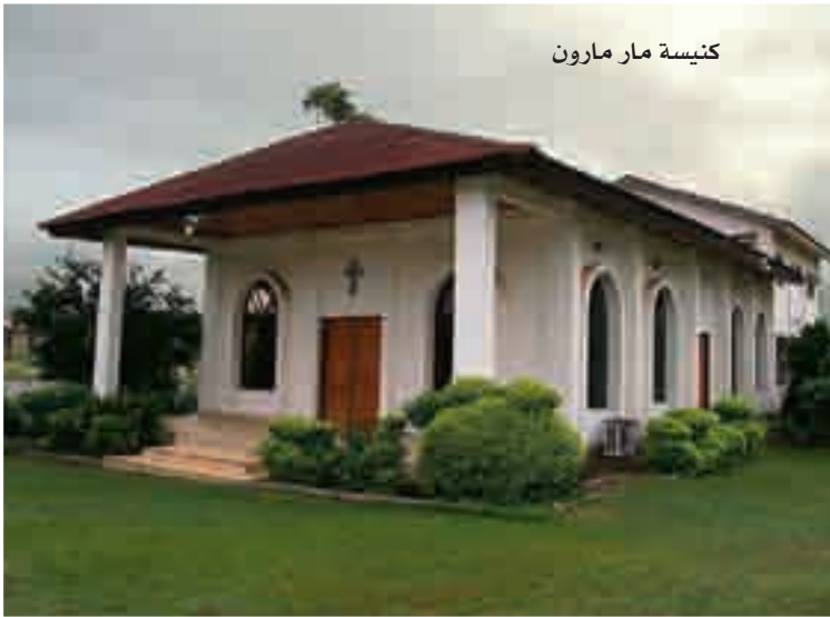
كنيسة مار مارون

يعمل بدون توقف، فهو خادم كنيسة مار مارون في اكره، وخادم كنيسة مار شربل في كوماسي، عدا النشاطات الروحية والاجتماعية، وشؤون المدرسة المارونية اللبنانية الى نادي الشبيبة، فهو رجل دين مثقف جداً خاصة في علم النفس، فالذي يختاره الرب لا احد يقف بطريقه لذا تخلى عن الحياة المدنية ليكون خادم الهيكل. ومجلة الحاضر تشكره على اهتمامه ومحبهه وتسهيل مهمتها. وفي مكتبه اجرت الحاضر معه هذا اللقاء.