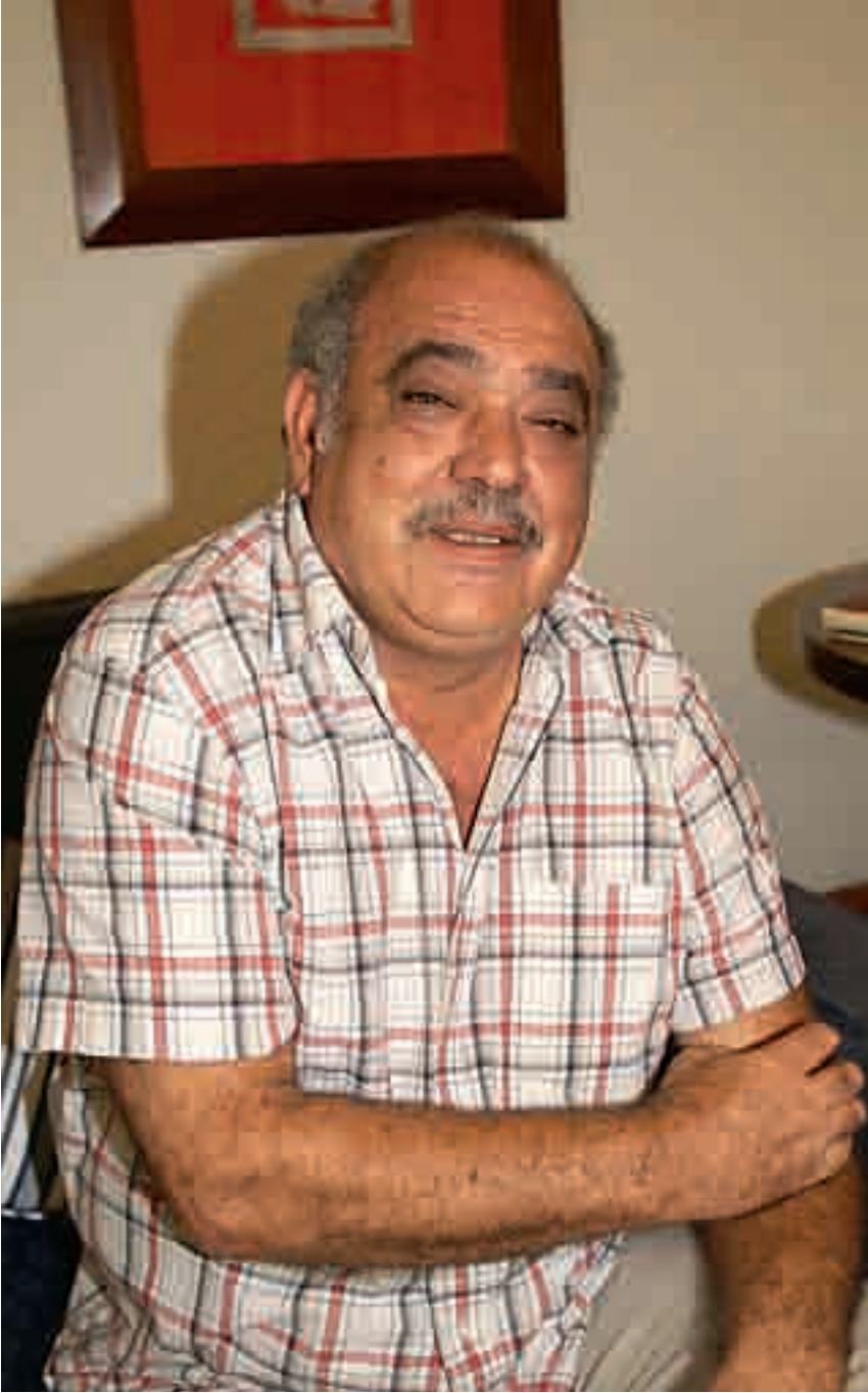
الجالية صورة عن الوطن

المسؤولين في غانا وشد روابط التعارف التجاري والاقتصادي والثقافي وتقديم بعض المنح المدرسية للشعب الغاني هذه الامور تنعكس ايجابياً على الجالية.