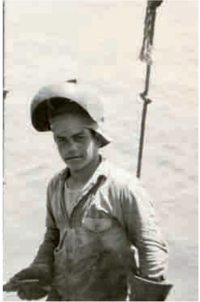
اثناء عمله في انابيب النفط