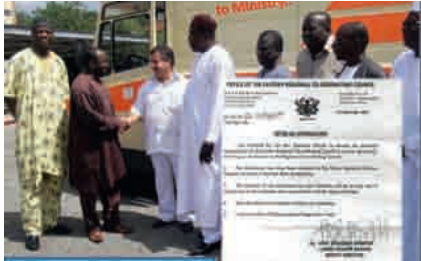
المساعدات للدولة الغانية

يقدرني الله على رد جزء من الجميل عربوناً على محبتي لهم.