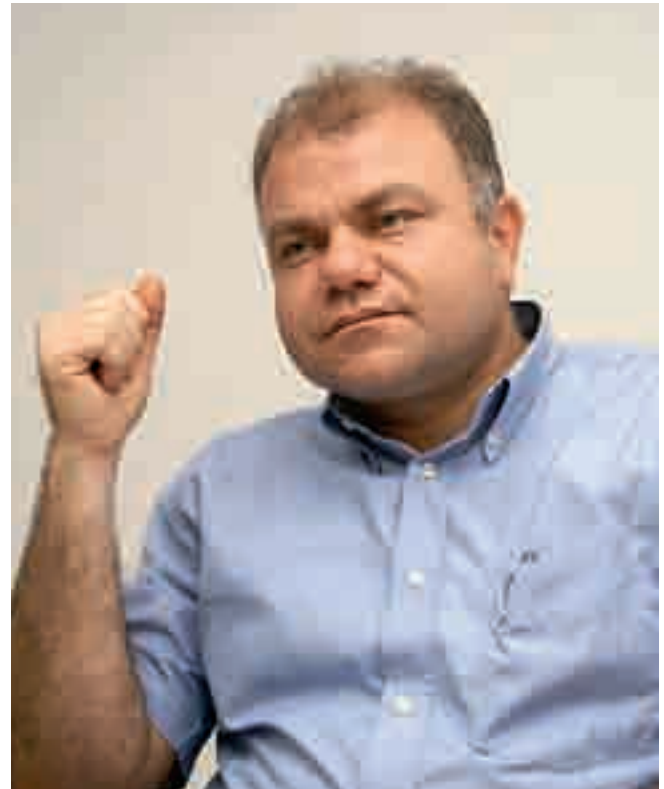
اشجع الصناعة اللبنانية