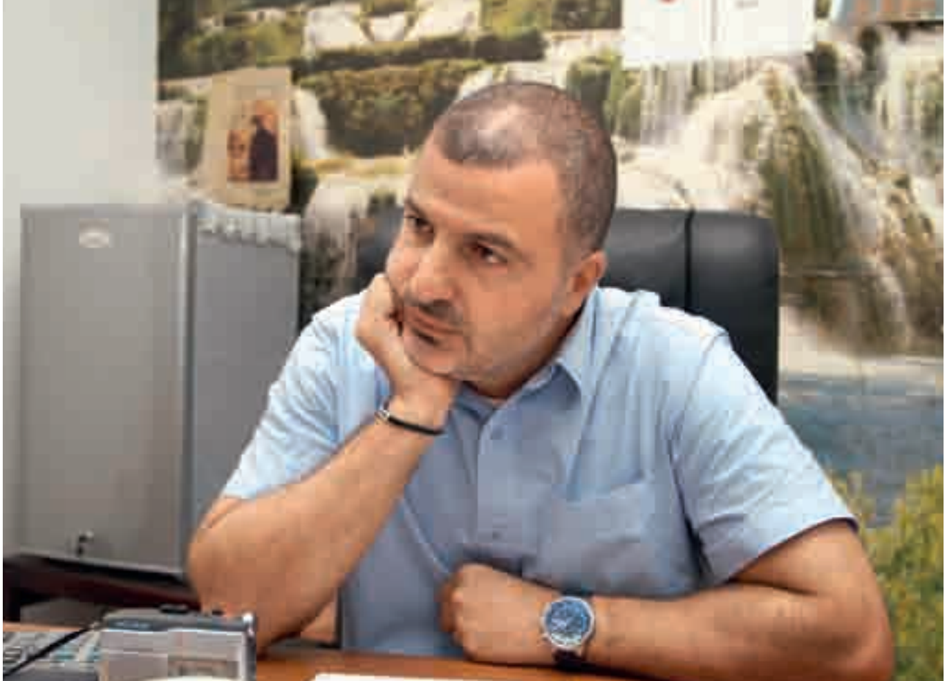
اعيش حلم العودة الى الوطن

لقد امضيت حياتي خارج لبنان مع الاسف الشديد ولا استطيع