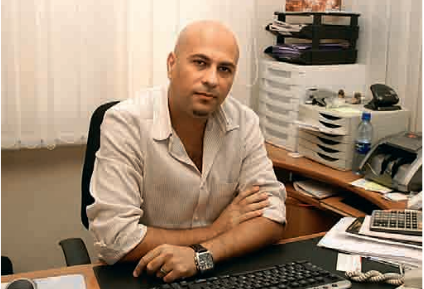
في أفريقيا تعيش غربتين

لم نستطع حتى الآن فرص احترامنا في افريقيا لاننا غير