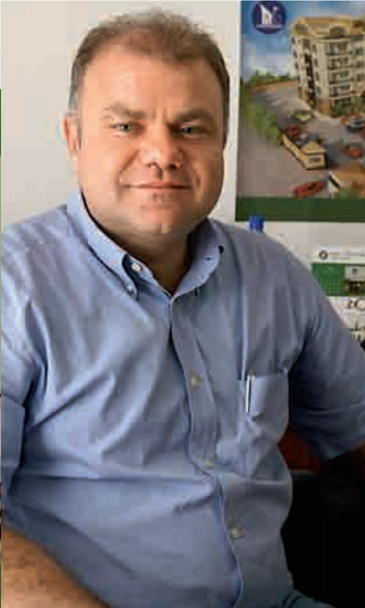
بحاجة الى سفارة قوية