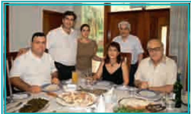
في منزل جات غصوب، كوماسي