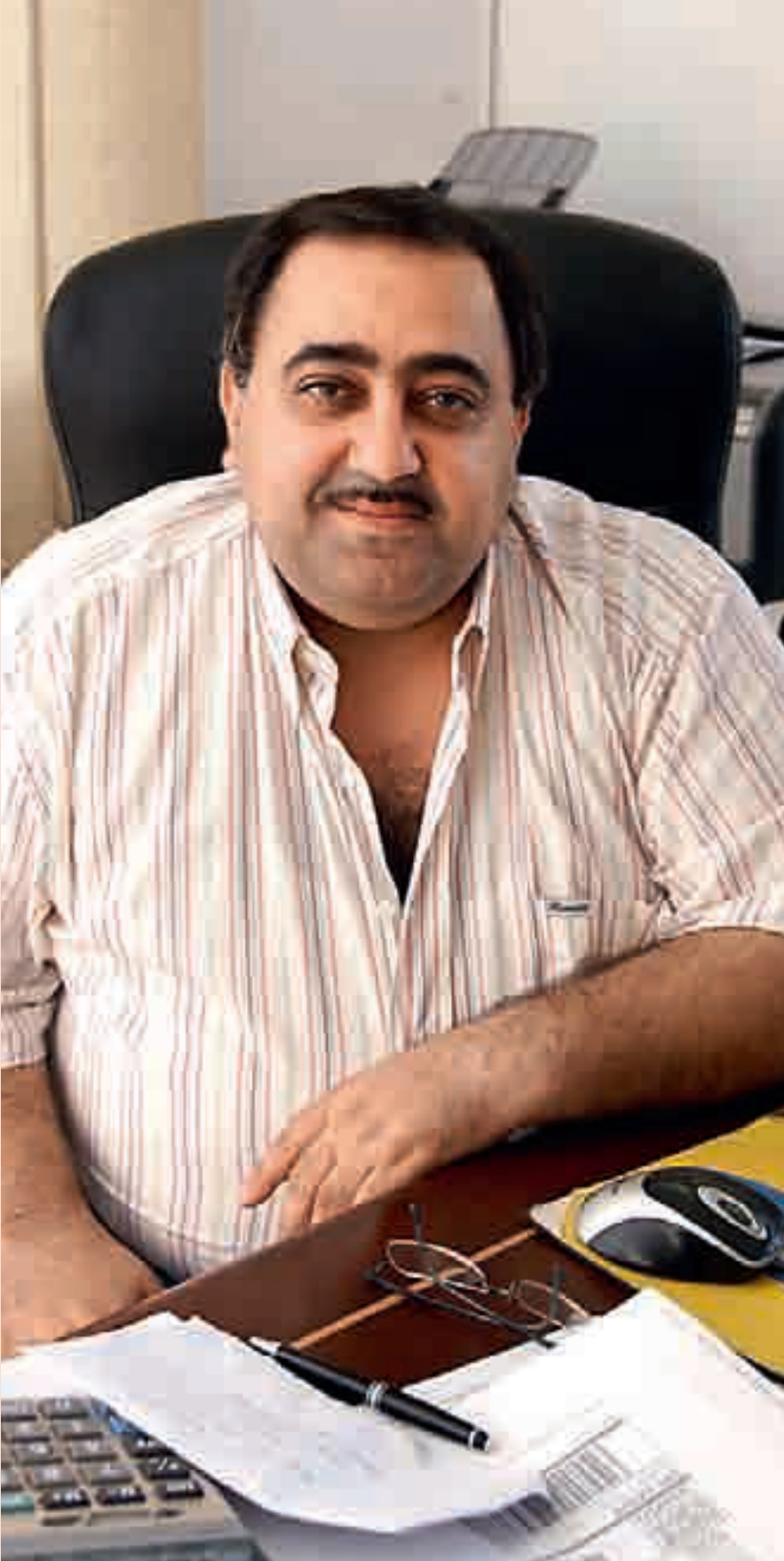
اوزع كتب عن تاريخ وحضارة لبنان