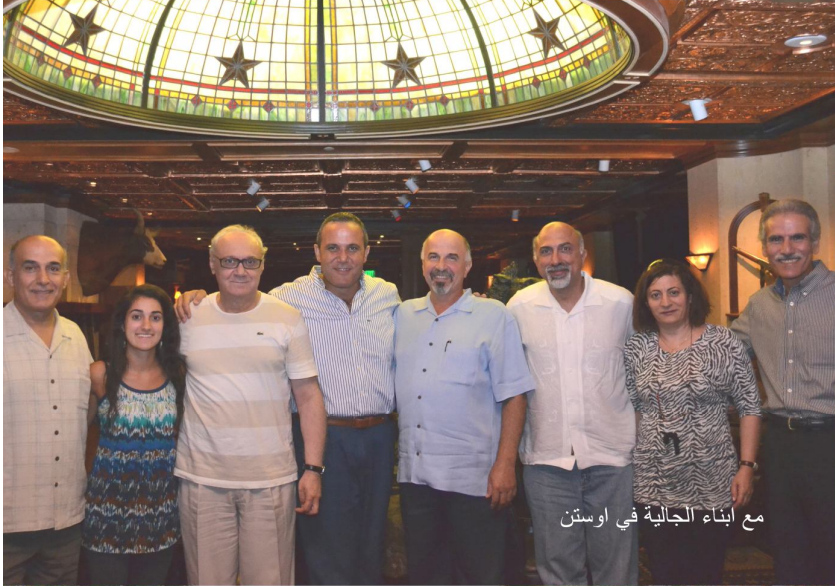
مع ابناء الجالية في اوستن