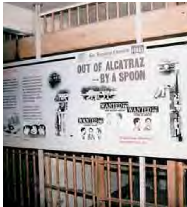
بعض الذين استطاعوا الهروب من السجن