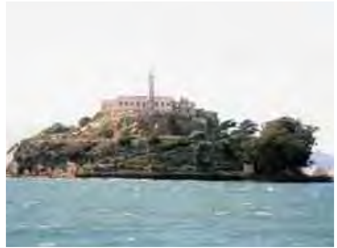
السجن ضمن جزيرة بحرية منعاً للهروب