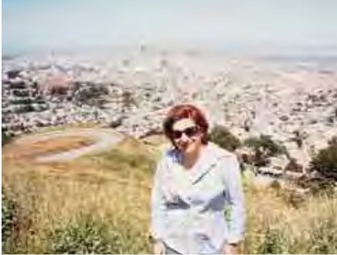
اعلى تلة في سان فرانسيسكو حيث تظهر المدينة وتدعى Twin Peaks