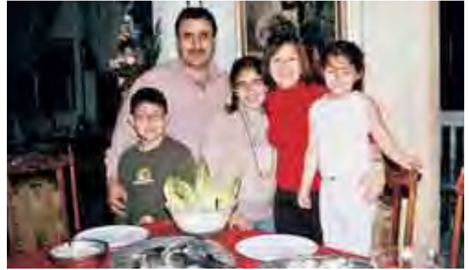
مع جورج حبشي