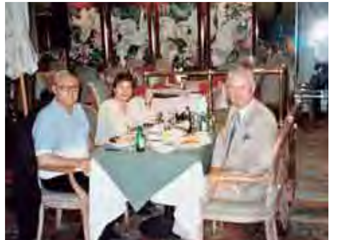
مع غسان صادر في لوس انجلوس