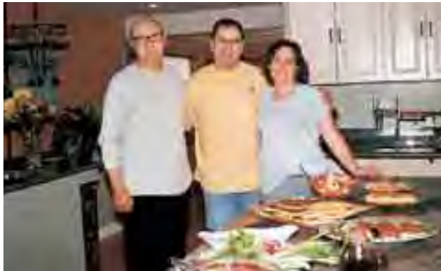
في منزل ربيع بلوط