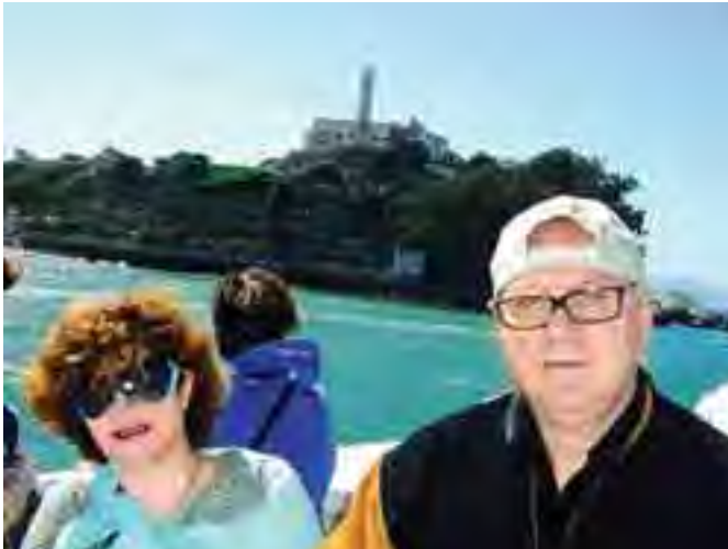
الذهاب بحراً الى سجن Alcatraz