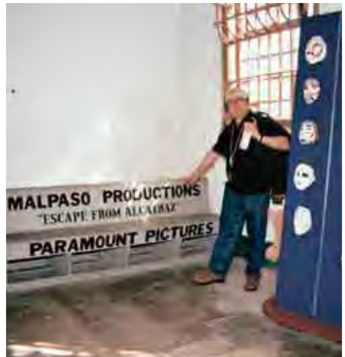
داخل السجن تم تصوير فيلم Escape From Alcatraz