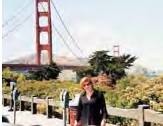
امام جسر البوابة الذهبية في سان فرانسيسكو