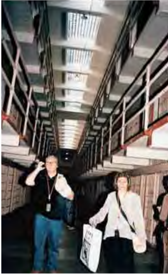
داخل سجن AlCatraz الذي تحول الى مركز سياحي