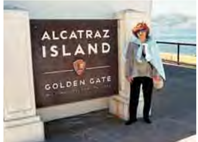
على ارض السجن الذي كان من اقصى السجون في العالم