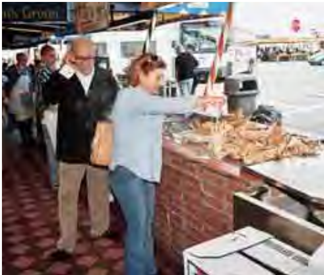
اشهر سوق للسمك في العالم