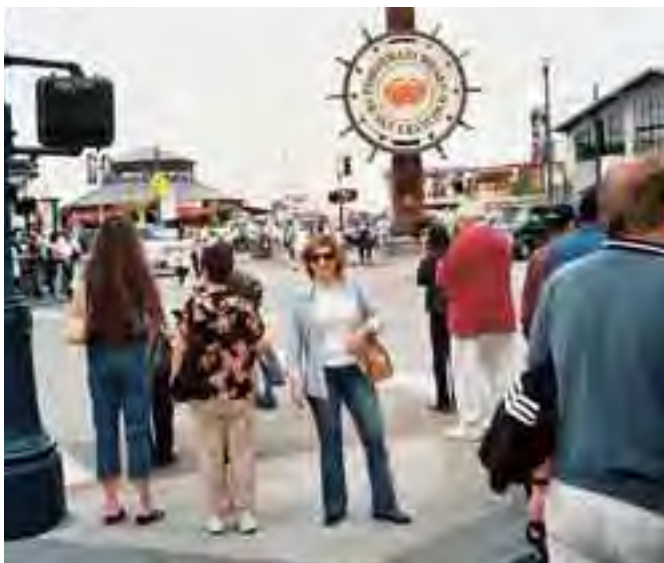
شارع Fisherman's الذي لا ينام