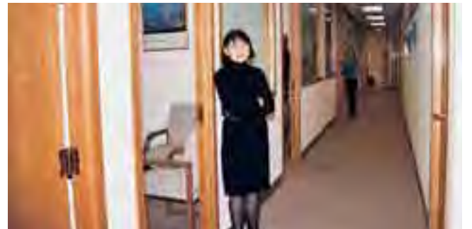
مكاتب القنصلية والكل في خدمة الوطن