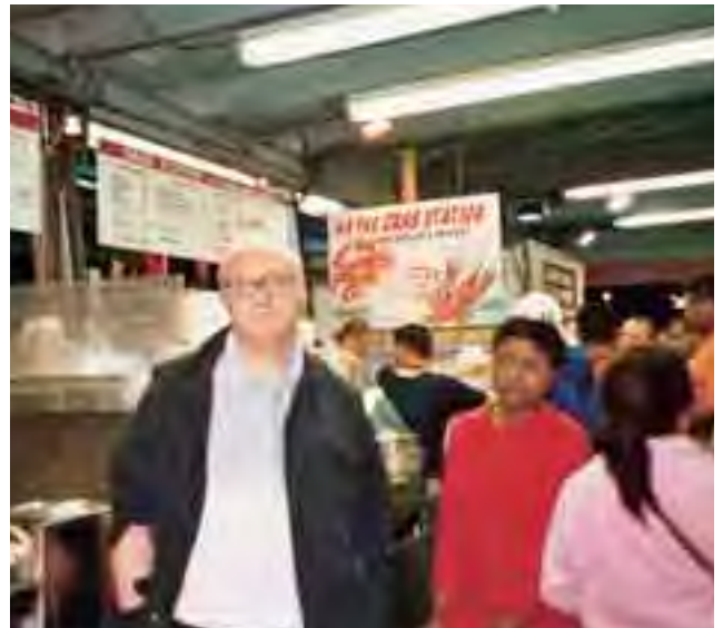
سوق السمك الشهير Fisherman's Wharf