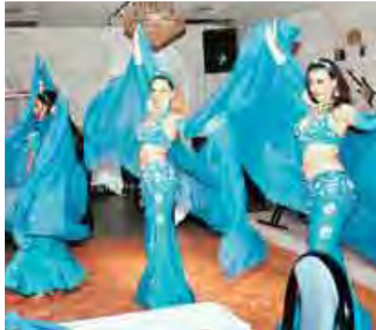
استعراض راقص باللباس الازرق