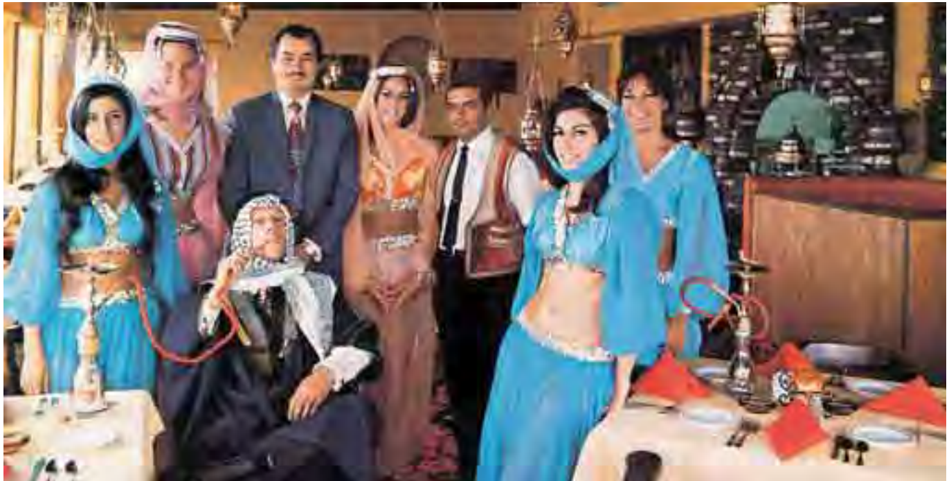
طوني في مطعم الشيخ انطون

- عام ١٩٥٦ وصلت سيدة الى عجلتون وهي ابنة زوجة ابن عمي ووالدها من مزرعة كفرذبيان آتية من الولايات المتحدة الاميركية لزيارة الوطن وانا كنت