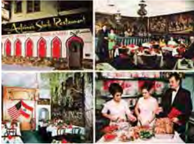
لقطات في مطعم الشيخ انطون

شقيقي تعلموا وكبروا وتزوجوا وساعدت جميع افراد العائلة للمجيء الى اميركا كي يعملوا ويستفيدوا ويعودوا الى وطنهم هذا كان حلمي ان نعود جميعاً الى لبنان.