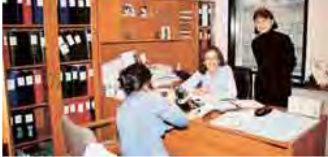
بعض السكرتيرات في خدمة الجالية