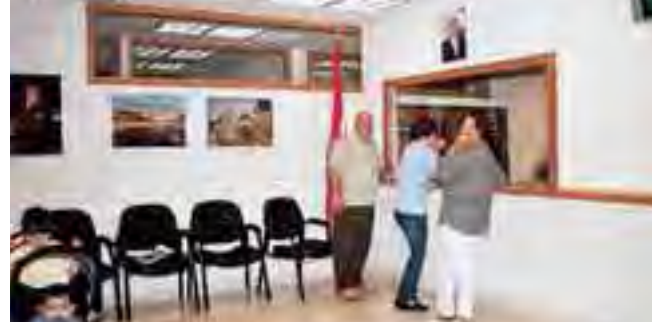
صالة المراجعات داخل القنصلية العامة