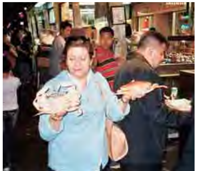
سلاطين والصغير وزنه كيلوغرام