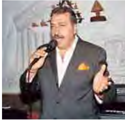
المطرب ليثون الصوت الساحر