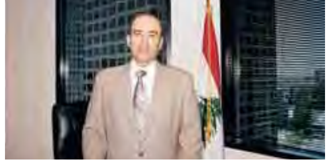
القنصل العام شربل وهبة