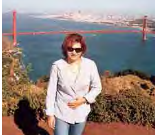
الجسر الذهبي الشهير