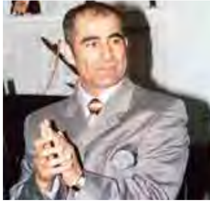
المطرب محمد عامر والاجواء العربية