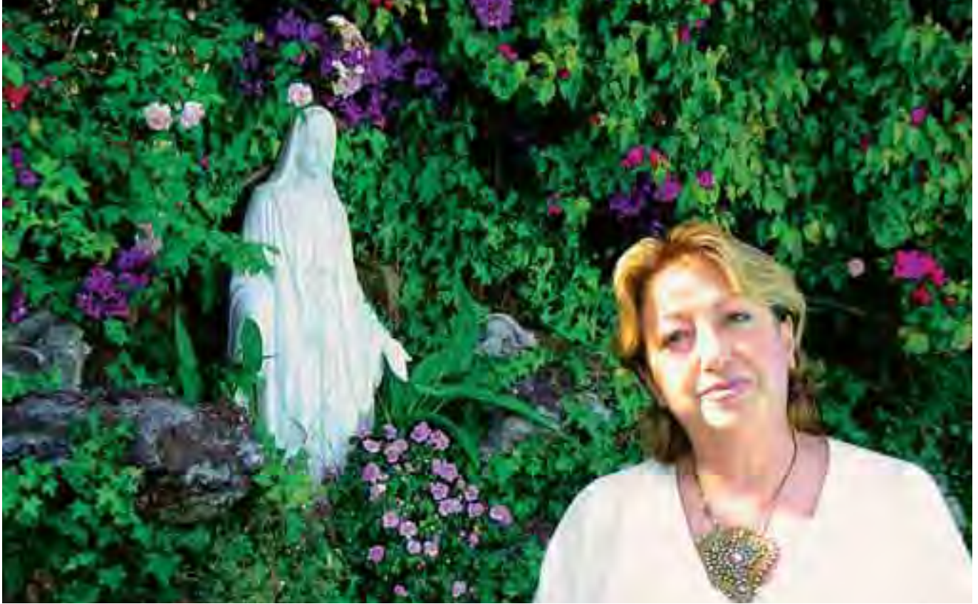
نعمل على توحيد الكنيسة