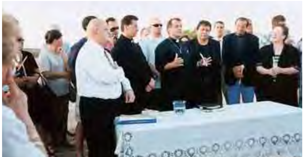
وضع حجر الأساس لكنيسة مار شربل في لاس فيغاس

– ارتسمت كاهناً في ١٦ أيلول ١٩٨٤ فقد خدمت بالرهبانية اللبنانية المارونية ثم في جبيل، الى أن انتقلت الى جامعة الكسليك ومن ثم الى باريس لدراسة الدكتوراه بالفلسفة الوجودية في السوربون لاني كنت متأثراً بتلك الفلسفة. وصلت الى الولايات المتحدة الاميركية عام ١٩٩٢ وبالتحديد الى سان دياغو فقد عشت القلق في هذه البلاد وترددت كثيراً في شراء