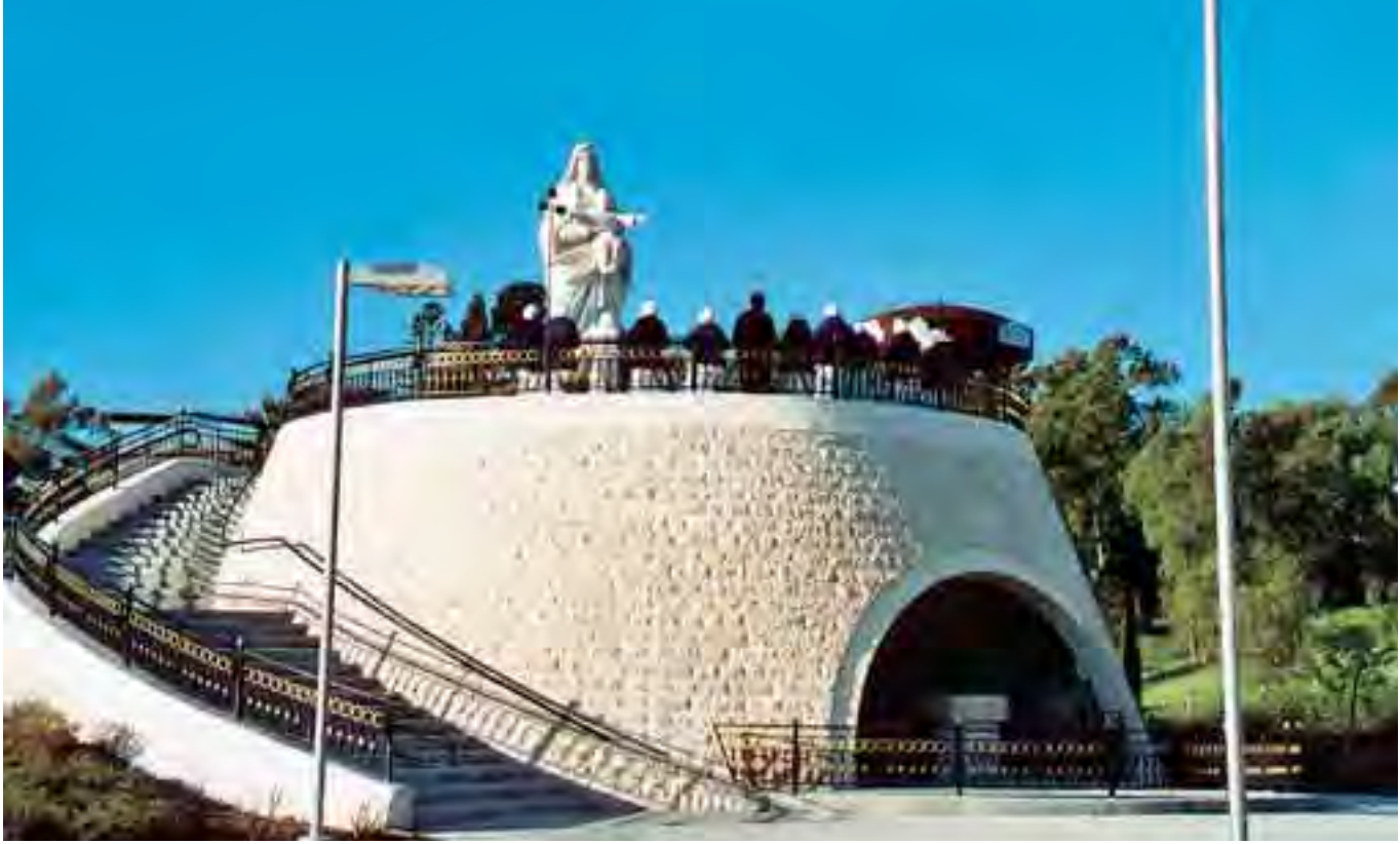
مزار حريصا في سان دياغو