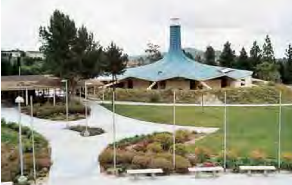
كنيسة مار أفرام