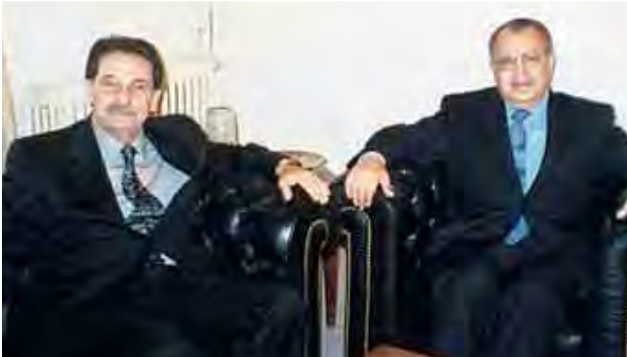
السفير مصطفى مصطفى مع القنصل تركية

لبنان فهذا يعود ايجابياً على الاقتصاد اللبناني.