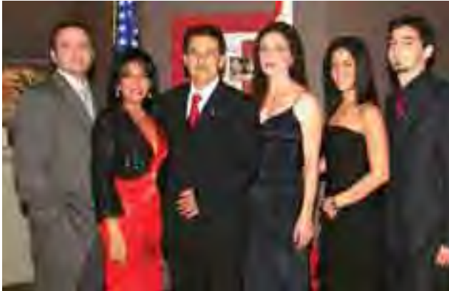
القنصل مع عائلته