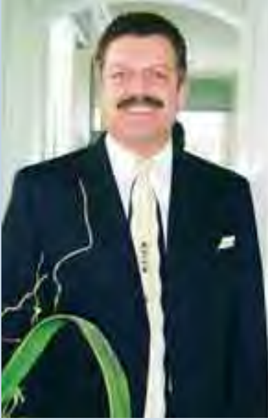
بقلم: شارل ألبير حداد لوس أنجلوس - كاليفورنيا

إذا اعتبرنا ان اولادنا يكوّنون نصف حاضرنا، فبالأكيد هم، كل مستقبلنا.