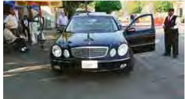
لوحة سيارتهما باسم Cedar