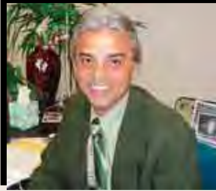
بقلم ديمتري يزبك كاليفورنيا