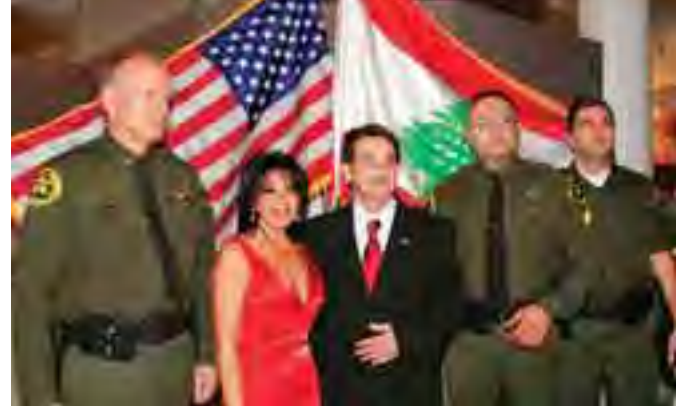
مع بعض الرسميين الاميركيين