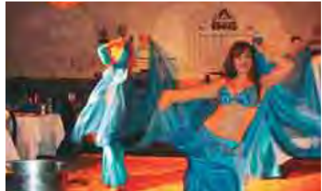
لقطة من الاستعراضات