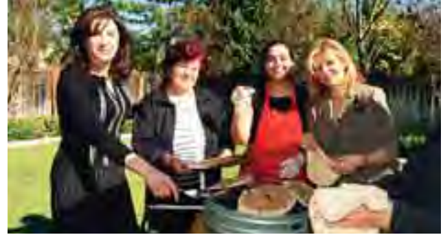
بعض الوجوه اللبنانية تجتمع حول الصاج