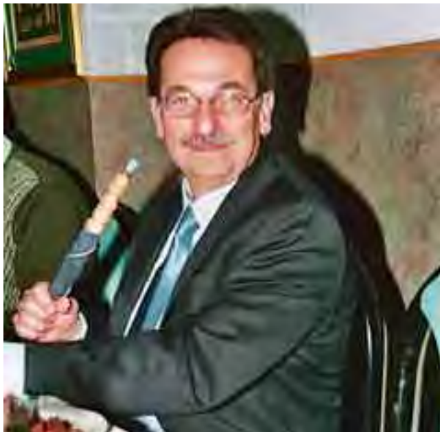
القنصل الفخري تركية وجلسة انسجام