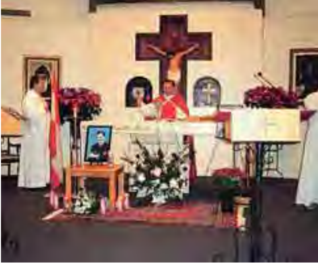
قداس عن روح الشهيد جبران تويني