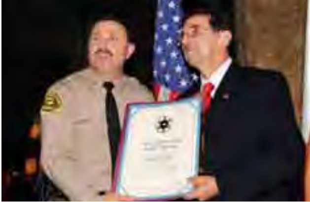
كاري نلبنديان يقدم له وسام من شريف لوس انجلوس