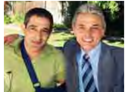
ديمتري يزبك مع النجم ريمون بريدي