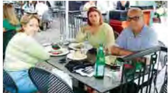
كليير مع مجلة الحاضر