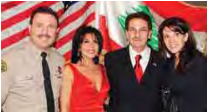
مع كاري نلبنديان وعقييلته