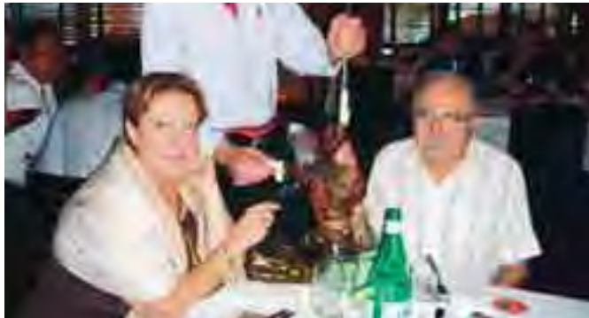
في المطعم البرازيلي