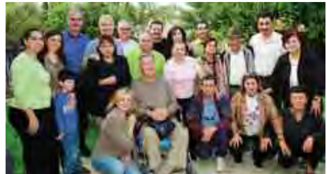
وجوه من الجالية اللبنانية في منزل كيلة