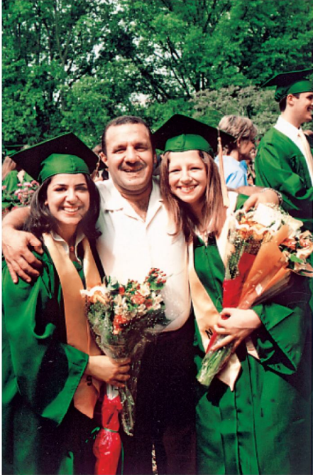
ضومط والفرمة الكبرى