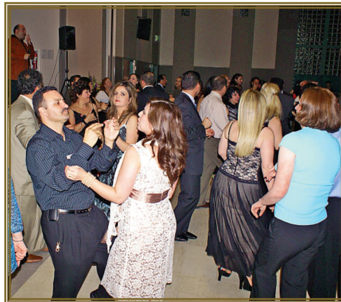
الرقص حتى الصباح

to help your business in many ways. As its membership grows, so does the opportunity for each of you to share your ideas, resources, and find ways to enhance your business. We want to market your businesses to our community and beyond. The directory is just one way we offer to make you known. We also offer monthly networking meetings as well as special events for our members.