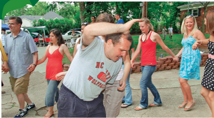
ضومط والدبكة اللبنانية