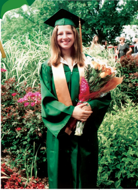
كرمينا في ثوب التخرج