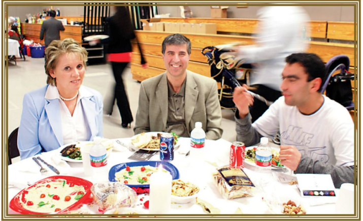
مسينت الحايك مع بعض المدعوين