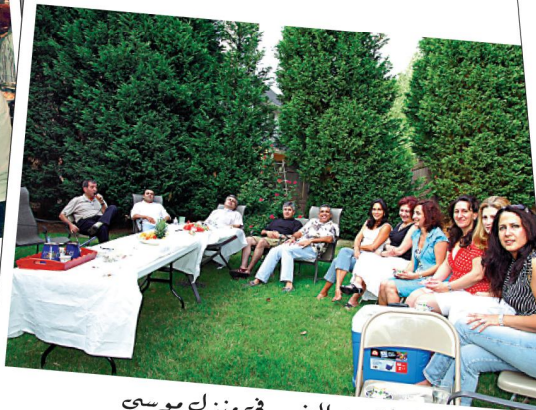
لقطة من الحضور في منزل موسى