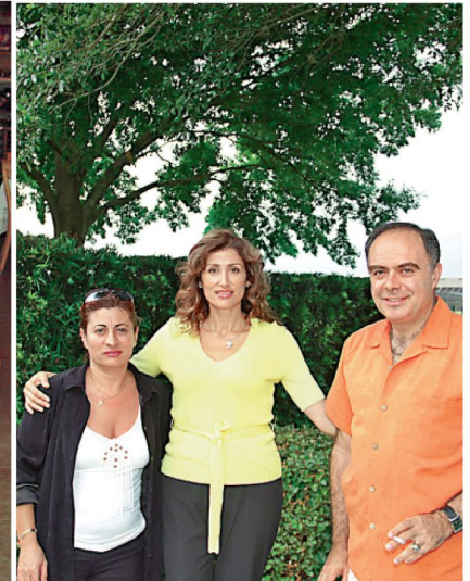
في منزل أميت وديولا حرب